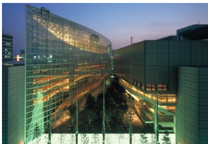
東京国際フォーラム ガラス棟

また12月8日（金）～26日（火）の期間には東京国際フォーラム開館20周年記念写真展「新たな船出」を開催。東京国際フォーラムの「過去・現在・未来」をテーマに、「過去・現在」のブースではかつて都庁があった時代の写真から開館後の様子や世界最大級のクラシックの音楽祭「ラ・フォル・ジュルネ・オ・ジャポン」、「丸の内キッズジャンボリー」を始めとする当社主催イベントの感動のシーンを中心に約100点の写真を紹介します。