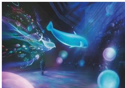
アクアリウム イメージ

株式会社東京国際フォーラムは、開館 20 周年を記念し、当館のシンボルである舟形のガラス棟を巨大な水槽に見立てた「光のアクアリウム」を 12 月 19 日（火）～26 日（火）に期間限定で開催します。バルーンを擬似的な生命体に見せる日本初の特演により、6m の巨大イルカが約 60m 吹き抜けの大空間を浮遊します。映像や照明・音響でガラス棟全体は幻想的な海の雰囲気になります。まるで海の中にいるような体験をしていただけます。