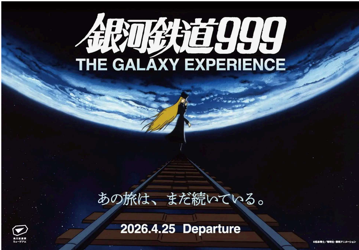
展覧会キービジュアル

角川武蔵野ミュージアムでは、1979年公開の映画「劇場版 銀河鉄道999」をベースに再構成した大規模空間体験型展示『銀河鉄道999 The Galaxy Experience あの旅は、まだ続いている。』を開催いたします。本展は映画を“上映する”のではなく、一本の叙事詩である劇場版を空間へと拡張する試みです。